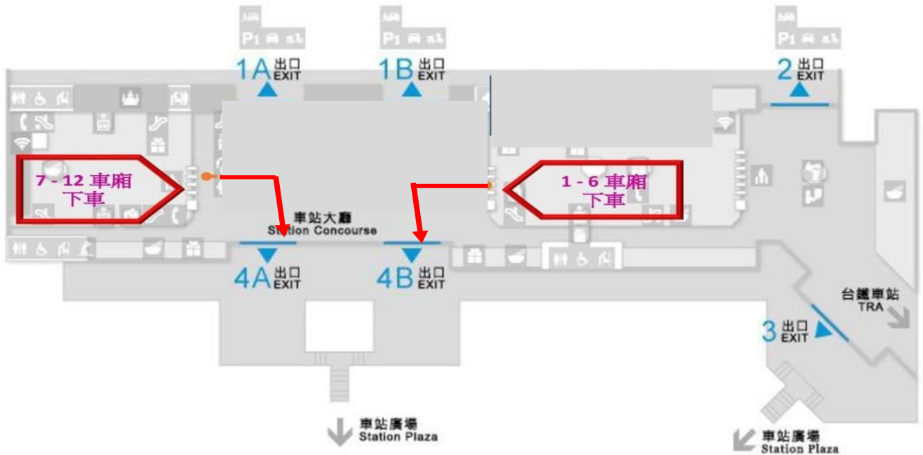
高鐵台中站下車至接駁車候車處路線示意圖